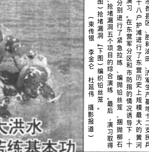
日前，我市各县区、胜利油田、济军生产基地十二支民兵队伍在垦利县进行了黄河防汛实战演习。在东营军分区和市防指的高度重视下，黄河二支抢险队伍分别进行了紧急拉练、编组拉练、编组拉练、插柳石枕、柳石接溜、抢堵漏洞五个项目的综合演练。最后，演习取得圆满成功。(上图)抢堵漏洞。(下图)编组拉练。